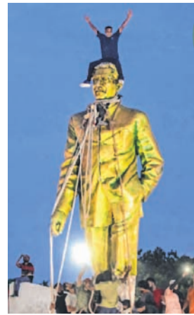
Anti-government protesters climbs atop a statue of Sheikh Mujibur Rahman, Bangladesh's founding father and parent of the country's ousted Prime Minister.

and Sejan Hossain, 19. At least 84 were taking treatment at Jashore General Hospital, said Harun-or-Rashid, a staffer of the hospital. Most of the deceased and injured are students. The Daily Star reported that thousands of people were celebrating the resignation of Prime Minister Sheikh Hasina at different parts of the town.